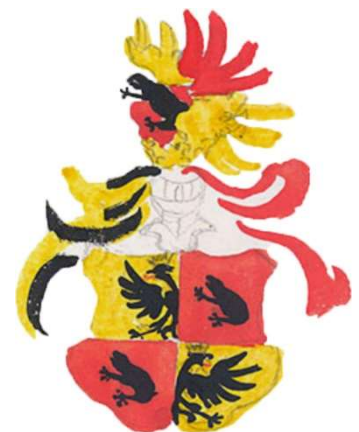
Wappen der Froschauer von Moosburg u. Mühlrain